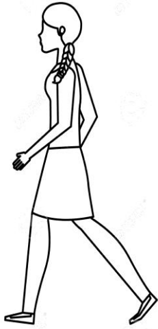
TO WALK - CAMINAR