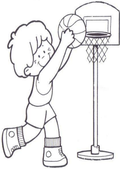
TO PLAY A SPORT- PRACTICAR DEPORTES