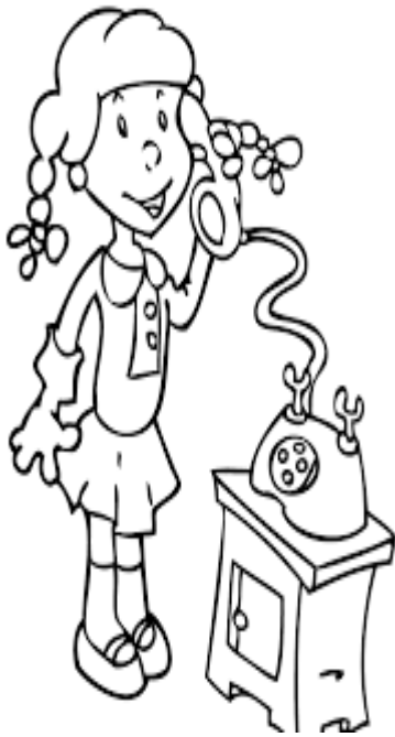
TO CALL- LLAMAR