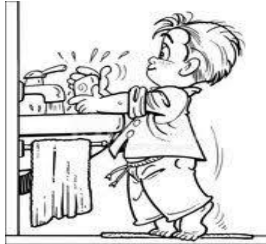
TO WASH- LAVAR