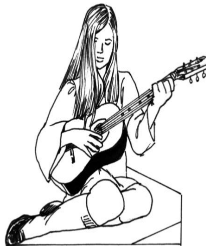
TO PLAY AN INSTRUMENT- TOCAR UN INSTRUMENTO